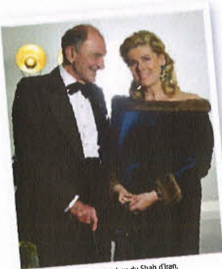
L'ancien ministre et ambassadeur du Shah d'Iran, Zahedi Ardeshir, avec la princesse Léa de Belgique.