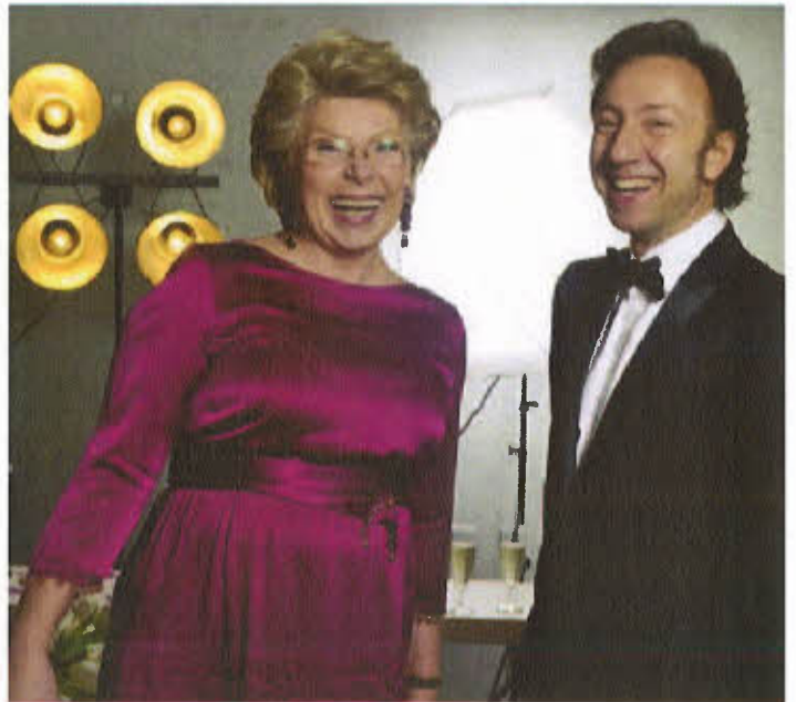
Quand deux Luxembourgeois se retrouvent: la vice-présidente de l'Union européenne Viviane Reding et l'animateur de télévision Stéphane Bern.