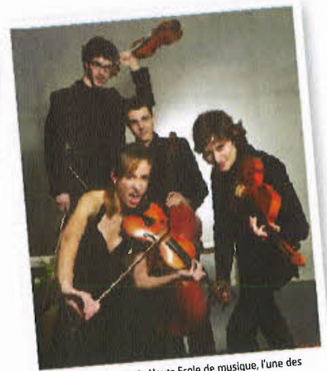
Le Quatuor Valère de la Haute Ecole de musique, l'une des nombreuses animations de la soirée.